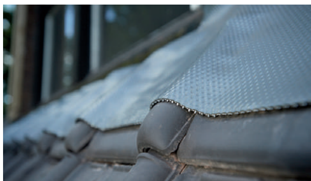
JUPES DE LUCARNES ET VELUX®