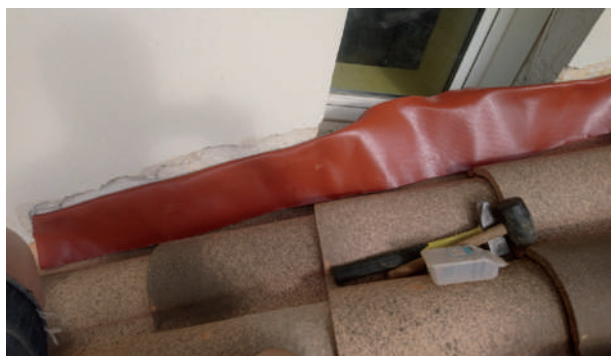
ABERGEMENTS SUR DIFFÉRENTS NIVEAUX